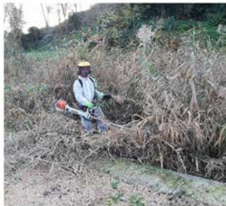
Faucardage en cours

Cela engorge le système et risque de limiter la durée de vie de l'équipement communal.